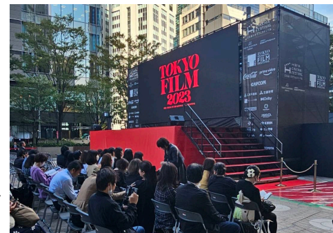
レッドカーペットステージ前