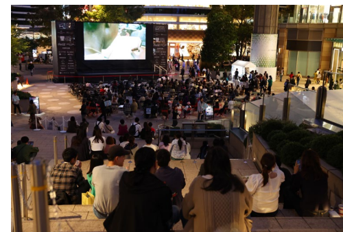
ミッドタウン日比谷ステップ広場